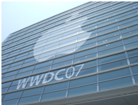
これもいつもの巨大アップルマーク

今年も並びましたが、早めに行動したためなんとかスクリーンに近い席を確保できました。学生を会場に入れず別会場に入れるなどの措置が効果があったと思われます。それにしても昨年のWWDCでのトップシークレットとは何だったのでしょうか？ どうも今回も明かされていないような気がします。