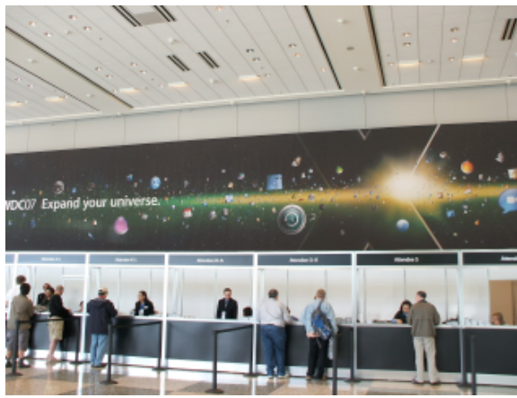
宇宙をイメージさせるディスプレイ

今年も土曜日のレジストレーションはできませんでした。日曜日は朝の7時から始まったそうですが、早朝からの態勢には毎年感心させられます。